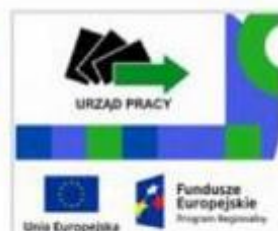
DOFINANSOWANIE DLA SAMOZATRUDNIONYCH (PUP)