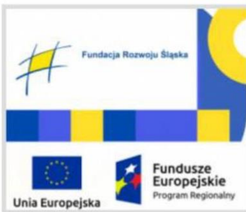
POŻYCZKI PŁYNNOŚCIOWE - FRŚ