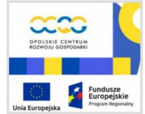
GRANTY NA KAPITAŁ OBROTOWY