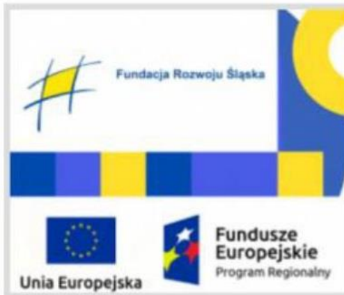
POŻYCZKI PŁYNNOŚCIOWE - FRŚ