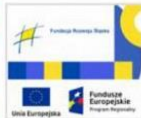
POZYCZKI PLYNNOŚCIOWE - FRŚ